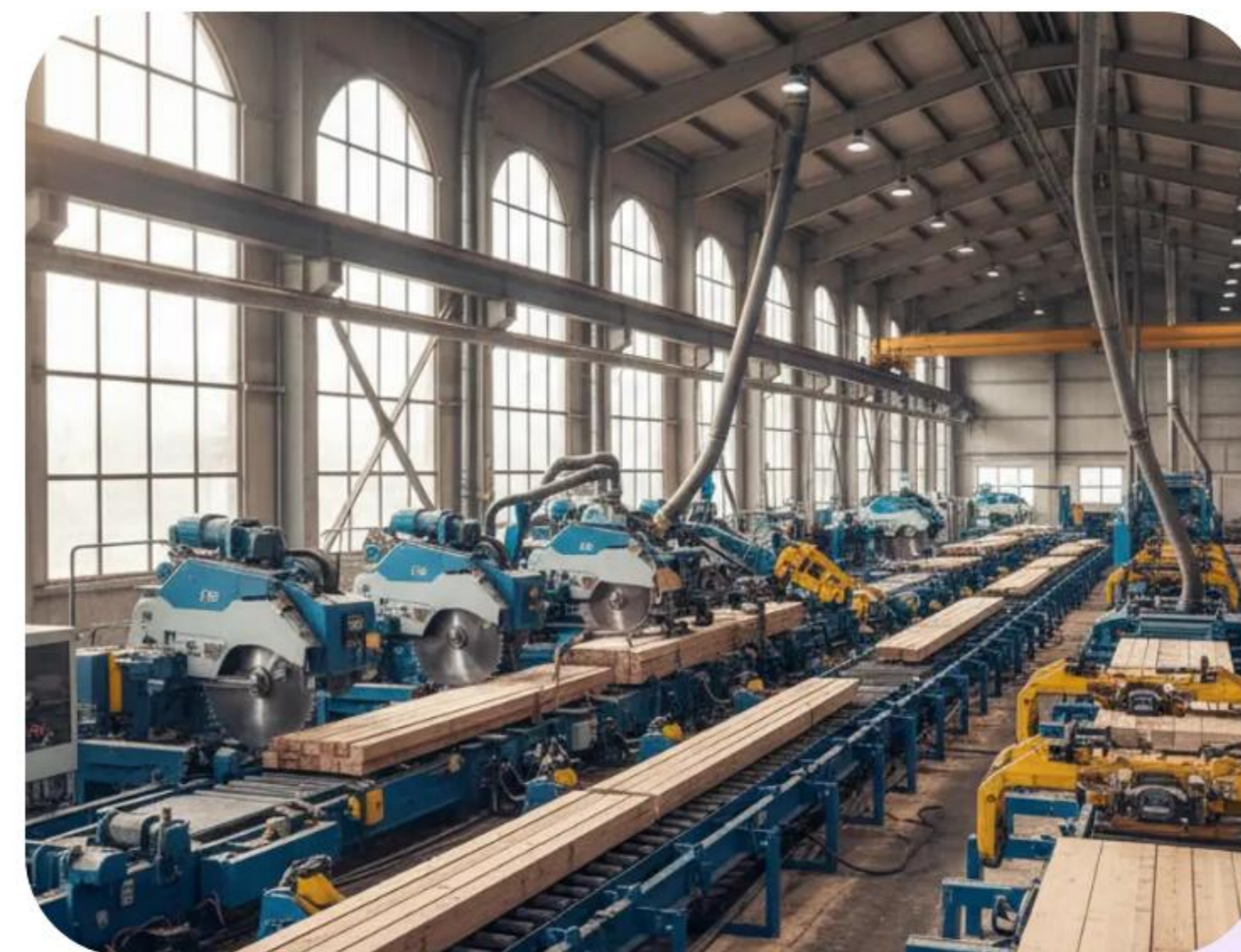
LIP Bled d.o.o.